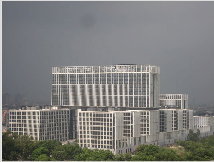
Tòa nhà mới của Bộ Công An