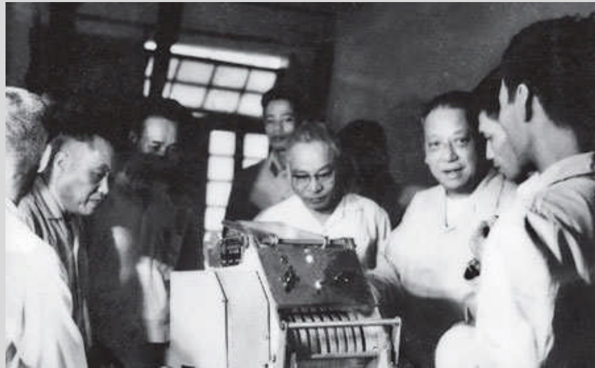
“Bộ trưởng Trần Quốc Hoàn trong lần kiểm tra kỹ thuật màng nhựa dán ép bảo vệ CMND tại Phòng Tài liệu nghiệp vụ, năm 1977”

( http://www.cand.com.vn/vi-VN/phongsu/2014/1/221014.cand )