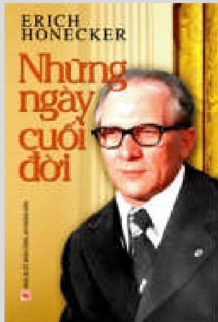
(Hanoi: NXB Công An Nhân Dân, 2011)