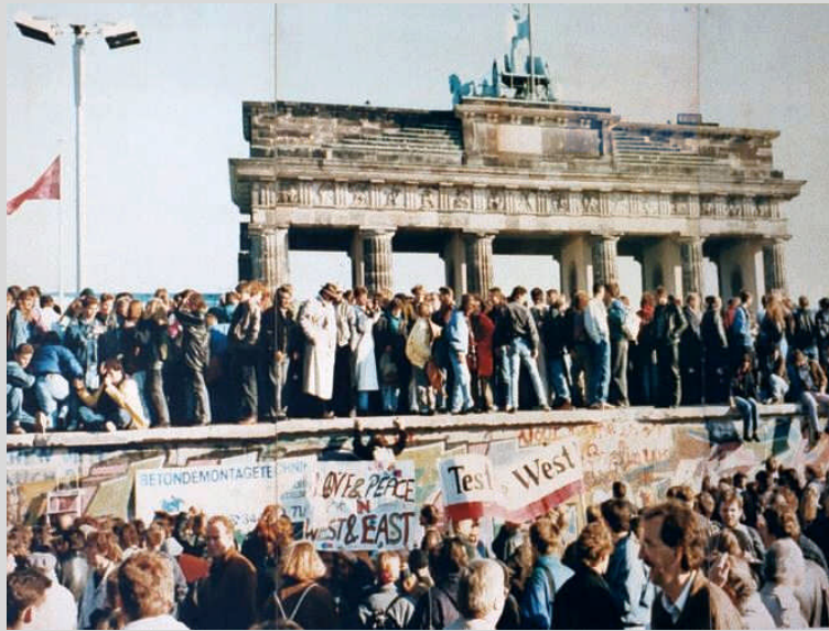
Bức tường Berlin đổ, 9.11.1989