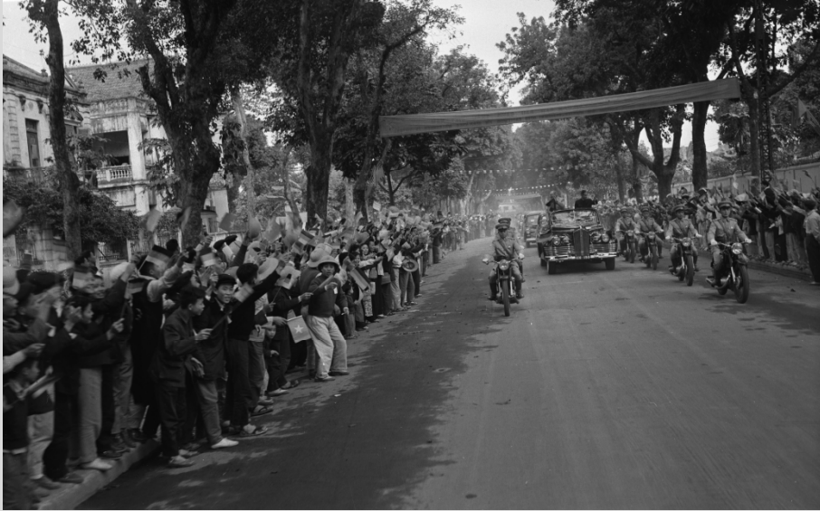
Otto Grothewohl, Thủ tướng CHDC Đức, đến thăm Hà Nội, 1-1959