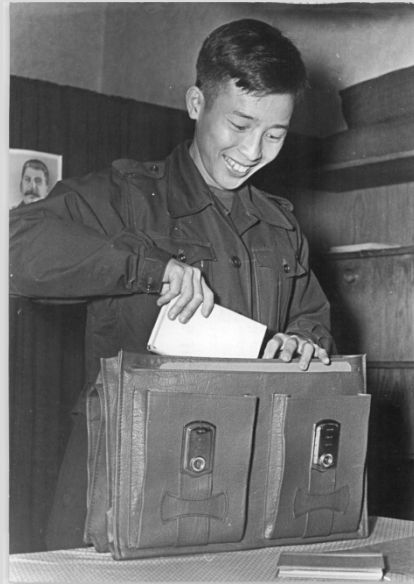
Lưu học sinh Việt Nam tại Leipzig (1953)